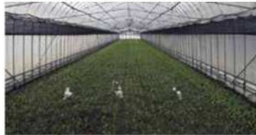
Industria de alimentación